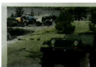
Il est possible de camper presque partout aux abords du parcours. Ici sur Buck-Island. Les embûches fatiguent rapidement les équipages.