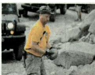
Les 19 km du Jamboree exigent aussi de l'huile de coude!